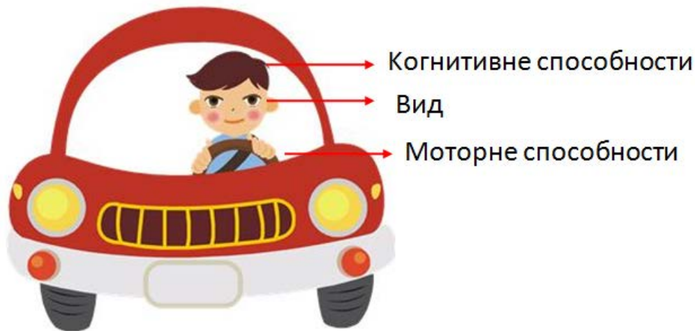
Слика 2. Психофизичке способности неопходне за безбедно управљање моторним возилом

Психофизичке способности неопходне за несметано одвијање перцепције, одлучивања и реакције, а тиме и за безбедну вожњу су: добар вид, очуване когнитивне и очуване моторне способности . Смањење било које од наведених способности може узроковати саобраћајну незгоду.